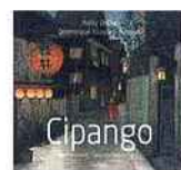
Nelly Delay, Dominique Rivoler-Ruspoli Cipango Japon-Occident, l'histoire d'une rencontre Phébus 159 p., 32 €

« Lus & conseillés par C. Lechapt Lib. Charlemagne (Toulon) J.-P. Agasse Lib. Sauramps-en-Cevennes (Ales) A. Janssens Lib. Page et Plume (Limoges) L. Bojgienman Lib. Nouvelle (Asnières-sur-Seine)