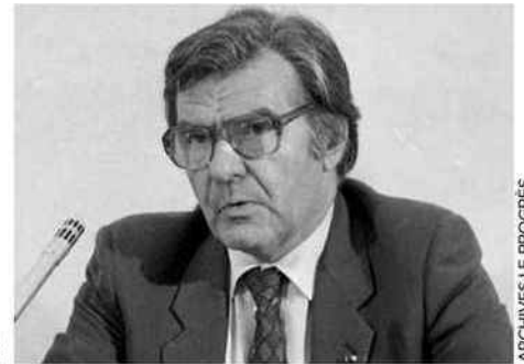
ARCHIVES LE PROGRÈS

Cette centriste annonce samedi 4 qu' elle quitte le groupe UDI pour celui de l'UMP au conseil municipal de Nîmes. Éluée déléguée à la Prévention de la délinquance des mineurs, elle explique n'être fâchée avec personne localement : "vu les scores du FN, je crois à un grand parti de droite. Fin mai, l'UMP prend un nouveau départ. Je voulais m'y accrocher tout de suite."